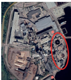
Kartbild över Externrening.

Undantaget är nöd- och ögonduschar på KM7 då detta system är isolerat och byggt på så sätt att legionellatillväxt motverkas.